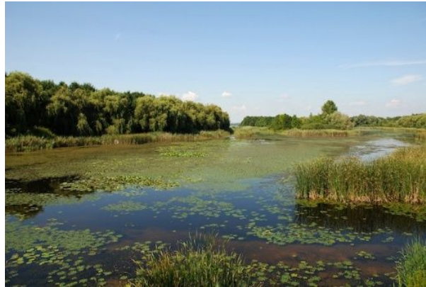
Fotografía 4. Humedal Torca – Guaymaral con espejo de agua y vegetación tipo macrófitas.

Este humedal cuenta con poblaciones de invertebrados, anfibios, reptiles, aves y mamíferos. Los invertebrados pertenecen a tres clases: Arácnida, crustáceo e insecto. Las aves presentes, entre las que se encuentran la Tingua bogotana, el cucarachero de pantano, la tingua piquirroja, la tingua moteada, el garciopolo, el pato barraquete y el chorlo playeros; comprenden (42) especies pertenecientes a (17) familias, de las cuales (14) son migratorias, (4) endémicas, y (5) en peligro de desaparición regional. Entre los mamíferos se reportan el curí ( Cavia anolaimae ), ardilla ( Sciurus granatensis ) y comadreja ( Mustela frenata ).